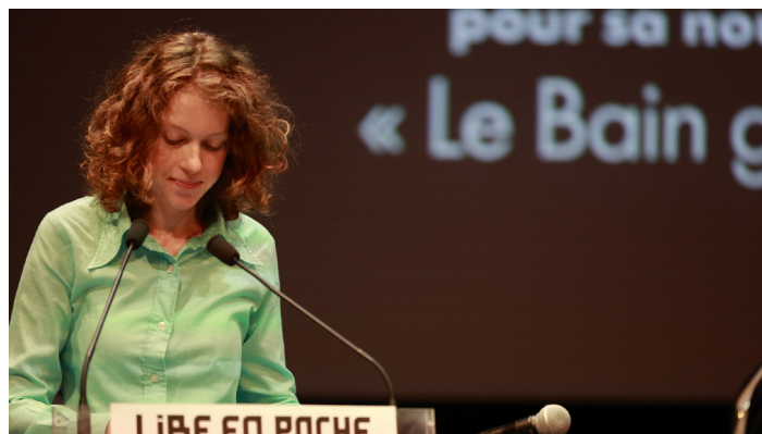
Remise du Prix lors de la soirée d'ouverture le 10 octobre 2025 au T45

Remise du prix : en juin au lycée puis le 9 octobre pour Lire en Poche